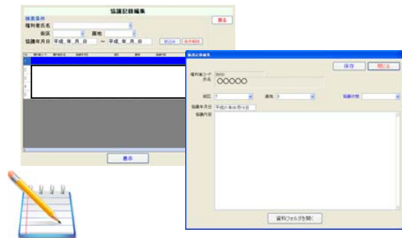
協議記録検索画面、協議記録編集画面

権利者や街区画地ごとの協議記録の新規作成、編集、削除がシステムで行なえます。協議記録の情報の共有ができるため、担当者が不在の時の急な問い合わせにも迅速な対応ができます。