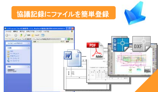
資料フォルダ登録画面

システム内の協議記録情報だけでは管理しきれない情報や添付資料（図面のスキャニングデータ・CAD データ・Word 文書等）などは、資料フォルダとして関係資料の格納、管理ができます。