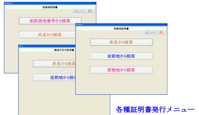
各種証明書発行メニュー

メニュー画面には証明書に対応する検索項目が表示されるため、担当者は迷わず証明書の発行ができます。