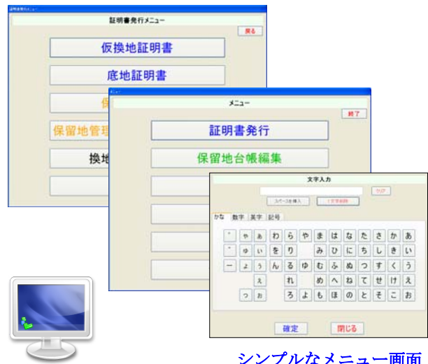
シンプルなメニュー画面